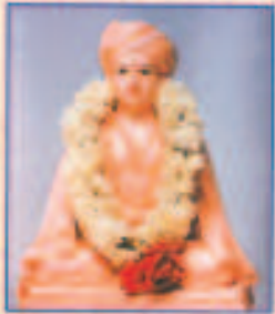
गुरुदेव शंकर अभ्यंकर